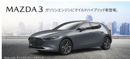
Body color ポリメタリックグレーメタリック

MAZDA2 (15C) は 車両本体価格の一例(税込) ¥1,508,650から