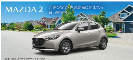
Body color プラチナオーツメタリック

特別仕様車 15S Smart Edition 車両本体価格の一例(税込) ¥1,647,500 全長 4,065mm 最小回転半径 4.7m 全高 1,500mm 全幅 1,695mm SKYACTIV-G 1.5/6速AT/2WD (FF) [L83-B1-0]