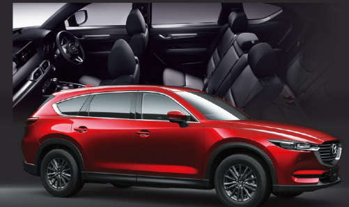
Body color ソウルレッドクリスタルメタリック