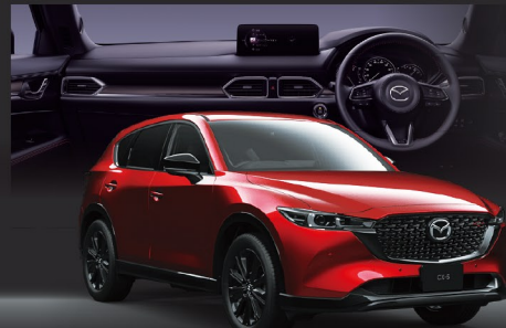
Body color ソウルレッドクリスタルメタリック