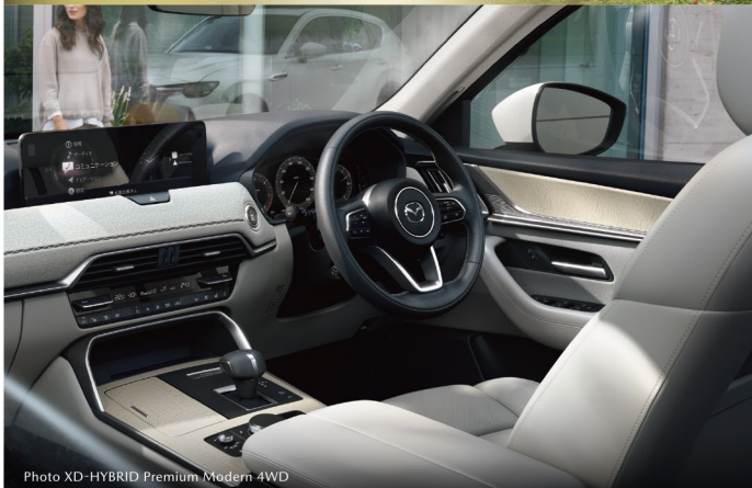
Photo XD-HYBRID Premium Modern 4WD

【写真掲載車】XD-HYBRID Premium Modern 車両本体価格の一割(税込) ¥5,527,500 e-SKYACTIV D / 8速AT / 4WD [SI-A-L1-01] ※写真掲載色(ロジウムホワイト)プレミアムメタリックは55,000円(消費税込)高 上記価格に含まれています。