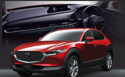
Body color ソウルレッドクリスタルメタリック