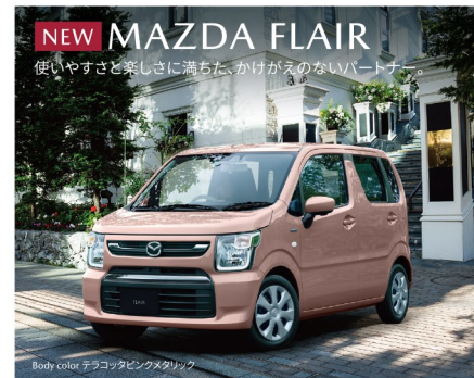
Body color テラコタピンクメタリック

MAZDA3 (15S) は 車両本体価格の一例(税込) ¥2,288,000から