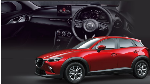
Body color ソウルレッドクリスタルメタリック