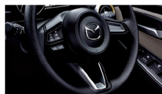
ステアリング(ウレタン)&ステアリング6時スポーク加飾(サテンクロームメッキ)