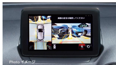
360°ビュー・モニター標準装備