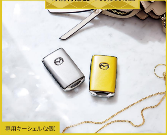
専用キーシェル(2個)

※360°ビュー・モニターは、ドライバーの安全運転を前提としたシステムであり、事故被害や運転負荷の軽減を目的としています。したがって、各機能には限界がありますので過信せず、安全運転を心がけてください。