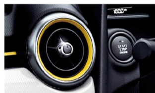
エアコンルーバーベゼル(内側/外側)：シトラス/サテンクロームメッキ