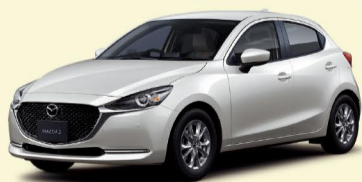
高圧縮ガソリンエンジン